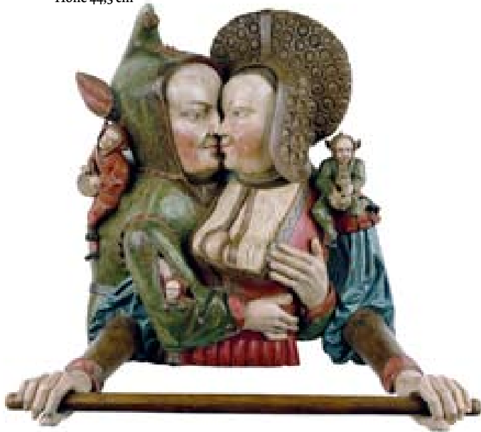
Arnt van Tricht Handtuchhalter mit Liebespaar um 1535, Eichenholz, farbig gefasst Höhe 44,3 cm

In den elf Jahren, die seit seiner Eröffnung 1997 vergangen sind, hat das Museum Kurhaus Kleve – Ewald Mataré-Sammlung einen exzellenten Platz in der deutschen Museumslandschaft erobern können. Seine über 50 Ausstellungen moderner und zeitgenössischer Kunst, der Aufbau einer bedeutenden eigenen Sammlung vom Mittelalter bis heute sowie die konsequente Verbindung von lokaler Geschichte mit internationaler Gegenwart sorgten nicht nur für überregionale Aufmerksamkeit, sondern führten auch zur Auszeichnung ›Museum des Jahres 2004‹ durch die deutschen Kunstkritiker. Das Museum ist untergebracht im