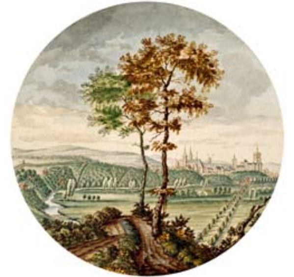
Jan van Call, um 1680/90 Blick vom Papenberg auf Kleve Aquarell, Durchmesser 105 mm Sammlung Angerhausen

frühen Beuys-Freundes Hanns Lamers auf. Entscheidend ist schließlich die Wiederherstellung der repräsentativen zweiläufigen Treppe, die ursprünglich das Erdgeschoss mit der Beletage und ihren eleganten Sälen verband. Mit der denkmalgerechten Restaurierung und behutsamen Erweiterung des Friedrich-Wilhelm-Bades wird die Verwandlung des ehemaligen Klever Kurhauses in ein Museum abgeschlossen. Die Stadt erhält das wichtigste architektonische Zeugnis aus der Blütezeit von ›Bad Cleve‹ zurück – und den Ort, an dem Beuys zu dem wurde, der er war.