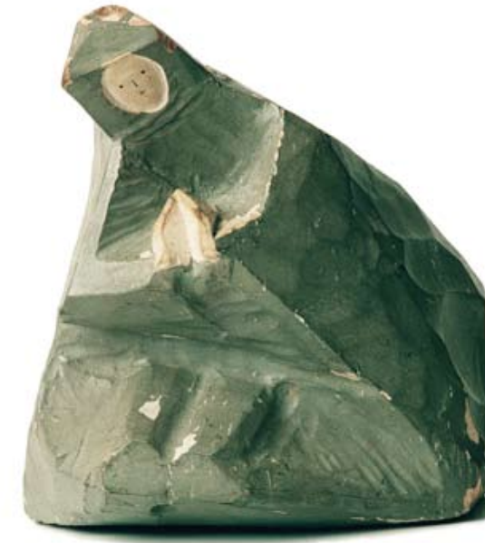
Joseph Beuys Madonna aus einer Krippe, 1955 Höhe 19,8 cm