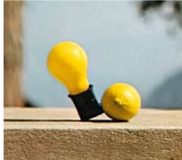
Joseph Beuys, Capri-Batterie, 1985 Glühlampe mit Steckerfassung und Zitrone, 8 x 11 x 6 cm

ehemaligen Kurhaus von ›Bad Cleve‹ und liegt inmitten der barocken Parkanlagen des Fürsten Johann Moritz von Nassau-Siegen. Bis 2006 war in dem westlichen Teil des Gebäudekomplexes, dem ›Friedrich Wilhelm-Bad‹, das Stadtarchiv untergebracht. Im Erdgeschoss hatte Joseph Beuys acht Jahre lang, von 1957 bis 1964, ein Atelier, in dem er seinen ersten großen Auftrag, das Mahnmal für die Toten der Weltkriege in Buderich schuf. Darüber hinaus arbeitete er hier an vielen wichtigen, zukunftsweisenden Werken. Das Museum soll nun um das Friedrich-Wilhelm-Bad erweitert werden – ein Vorhaben,